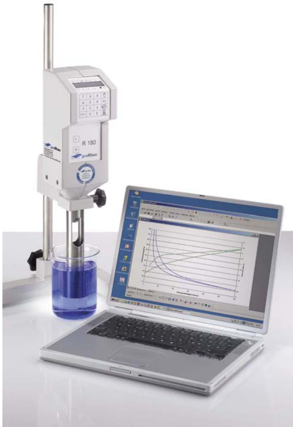
Abb. 1: Laborviskosimeter Rheomat R 180