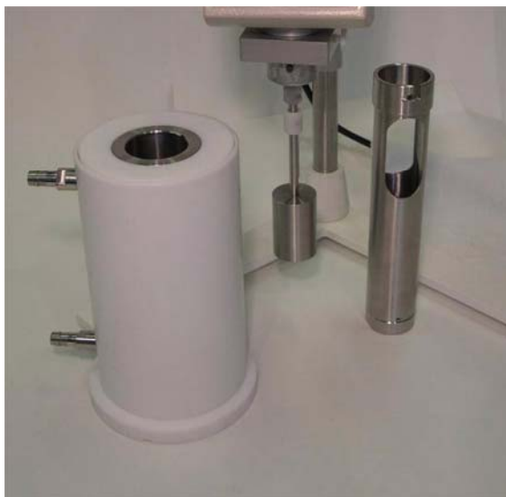
Abb. 2: Thermostatisierkammer