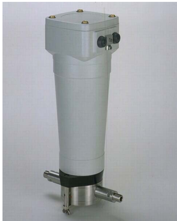
Abb 1: Inlineviskosimeter Covimat 105

Online- Viskosimeter haben bewiesen, dass sie wartungsfreundlich, präzise und störunanfällig arbeiten. Hierdurch können Personalkosten in der Größenordnung von 10 % bis 12 % eingespart sowie der Ausschuss minimiert werden. Allein durch die Kostenreduktion amortisiert sich die Investition innerhalb von 6 Monaten.